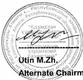
Utin M.Zh. Alternate Chairman of Association of Constructors of Kazakhstan

For and on behalf of The International Contractors Association of Korea